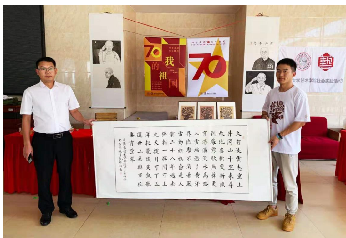
书法作品赠送革命基地

践优秀团队、全国暑期社会实践优秀课题成果。2017 年 7 月暑假组建“井冈逐梦”井冈山革命历史寻访调研与版画创作实践团，参与了江苏省庆祝改革开放 40 周年主题美术创作工作，以艺术的形式展示江苏改革开放和社会主义建设的辉煌成就。2018 年，实践团以纪念改革开放 40 周年为主题进行版画创作与实践活动，活动深入调研井冈山基地农村建设情况，以油画、国画等作品展现革命基地在改革开放过程中取得的丰功伟绩，团队获评团中央暑期实践优秀团队、优秀调研报告；2019 年以庆祝新中国成立 70 周年为主题进行实践活动，创作了大批版画、书法、篆刻作品，优秀作品受邀在井冈山革命基地展出，团队获评团中央实践优秀团队。